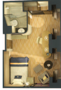
1C Einzelkabinen außen (ca. 16 m 2 ): Einzelbett, Bad mit Dusche.