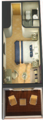
3B 3C 3F 3E 3D 3C 3F Zweibettkabinen Balkon 4A 4Z Zweibettkabinen Club Balkon (ca. 23 m 2 ): King-Size-Bett, das in zwei getrennte Betten umgewandelt werden kann, Loggia, Bad mit Dusche, großer Balkon. Die Balkone der Kategorien 3B , 3C und 3F sind durch verlagerte Rettungsboote erheblich sichtbehindert.