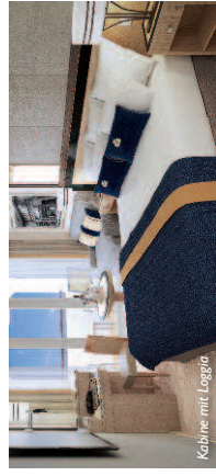
Kabine mit Loggia