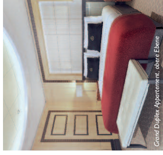
Grand Duplex Apartment, obere Ebene