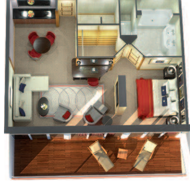
64 6Penthäuser (ca. 70 m 2 ): Eingangs- und Speisebereich, Wohn- bereich, Ankleidebereich, Gästebad, großer Balkon, Schlafbereich mit King-Size-Bett, das in zwei getrennte Betten umgewandelt werden kann, Hauptbad mit Bidet, zwei Waschbecken, Badewanne mit Whirlpool-Vorrichtung und separater Dusche.

*Die behindertengerechten Suiten der Kategorie 6T sind mit einer rollstuhlgehenden Dusche ausgestattet und verfügen nicht über einen begehbaren Kleiderschrank.