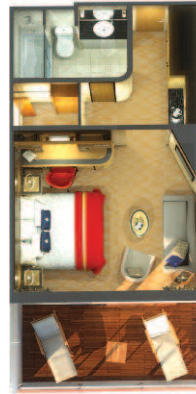
5A 5Z Princess Suiten (ca. 47 m 2 ): King-Size-Bett, das in zwei getrennte Betten umgewandelt werden kann, Wohnbereich, Bad mit Badewanne und inter- grierter Dusche, großer Balkon.