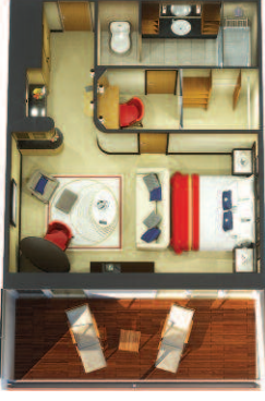
6S 6A 6T Queens Suiten (ca. 47 m 2 ): King-Size-Bett, das in zwei getrennte Betten umgewandelt werden kann, Ankleidebe- reich, Wohnbereich, Barbereich, Marmorbad mit Badewanne mit Whirlpool-Vorrichtung und inter- grierter Dusche, großer Balkon.

*Die behindertengerechten Suiten der Kategorie 6T sind mit einer rollstuhlgehenden Dusche ausgestattet und verfügen nicht über einen begehbaren Kleiderschrank.