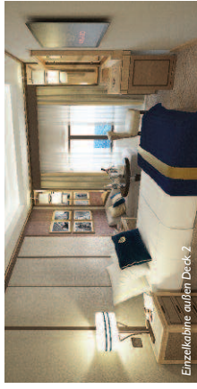
Einzelkabine außen Deck 2.