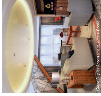
Grand Duplex Apartment, untere Ebene