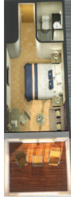
2U 2V 2Y 2Z Zweibettkabinen Loggia (ca. 25 m 2 ): King-Size-Bett, das in zwei getrennte Betten umgewandelt werden kann, Bad mit Dusche, Loggia.