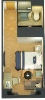
1A Einzelkabinen außen (ca. 16 m 2 ): Einzelbett, Bad mit Dusche.