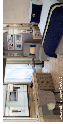
Einzelkabine außen Deck 3.