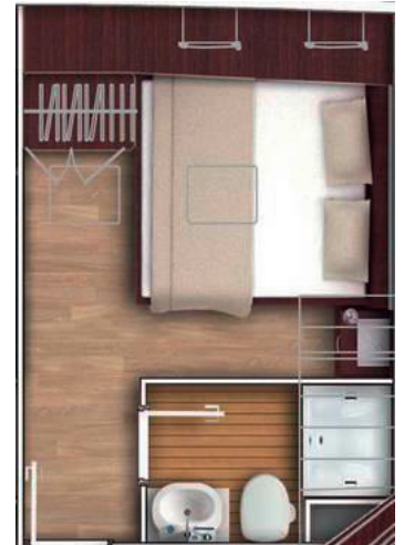
Double Bed Cabin Doppelbett