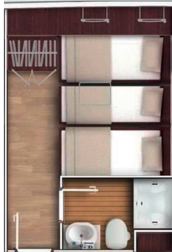
Three Bed Cabin 3-fach Bett