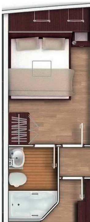
1 Master Cabin ca. 14 m 2

Doppelbett, großes Bad mit Dusche, Waschtisch und WC