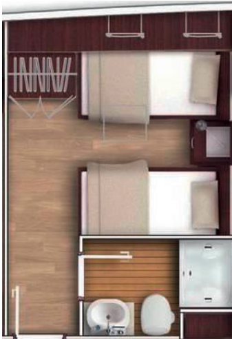
Two Bed Cabin 2 Einzelbetten