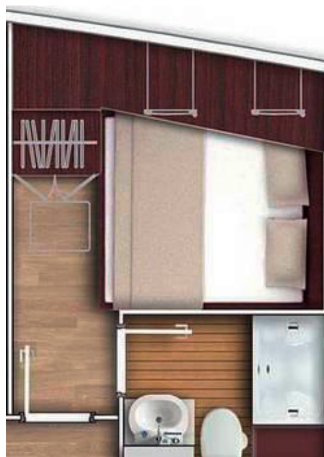
2 Long Cabin ca. 11 m 2 Doppelbett

Doppelbett, großes Bad mit Dusche, Waschtisch und WC